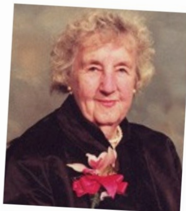
Virginia Henderson 1897-1996